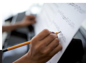
TEORIA E COMPOSIZIONE

SANTA Cecilia SCUOLA DI MUSICA DIOCESANA • BRESCIA