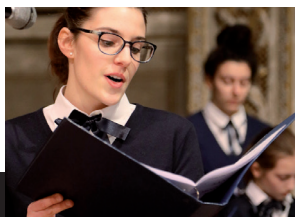
CANTO E CORO