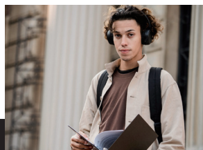
VERSO IL CONSERVATORIO