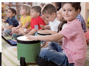
MUSICA PER I PIÙ PICCOLI